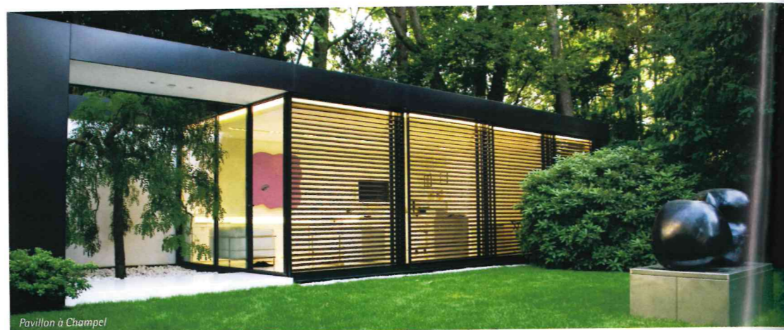
Pavillon à Champel