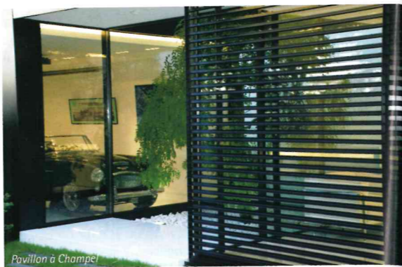
Pavillon à Champel

«De nombreux paramètres s'intègrent à notre réflexion au sujet d'une fenêtre: fonction, orientation, éclairage, efficacité d'isolation, etc. Cette recherche nous intéresse et nous amuse.» A. et D. Carneiro, réinterprètent la fenêtre et la déclinent dans de nouvelles formes contemporaines, de nouveaux formats et de nouveaux cadres. Leurs réalisations constituent le meilleur témoignage de leurs trouvailles en matière de design de fenêtre et de leur vision de l'enveloppe architecturale en général. Pour la clinique de Lausanne par exemple, les fenêtres présentent en façade une sorte de désordre organisé, très esthétique, comme si elles étaient positionnées de façon aléatoire, pourtant leur emplacement correspond aux besoins d'aménagement intérieur du bâtiment.