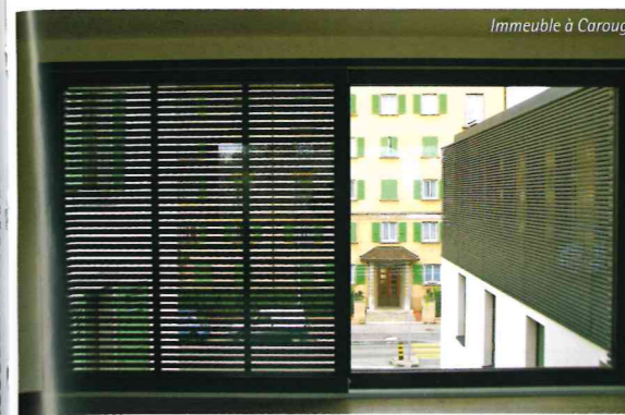
Immeuble à Carouge