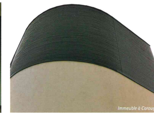
Immeuble à Carouge