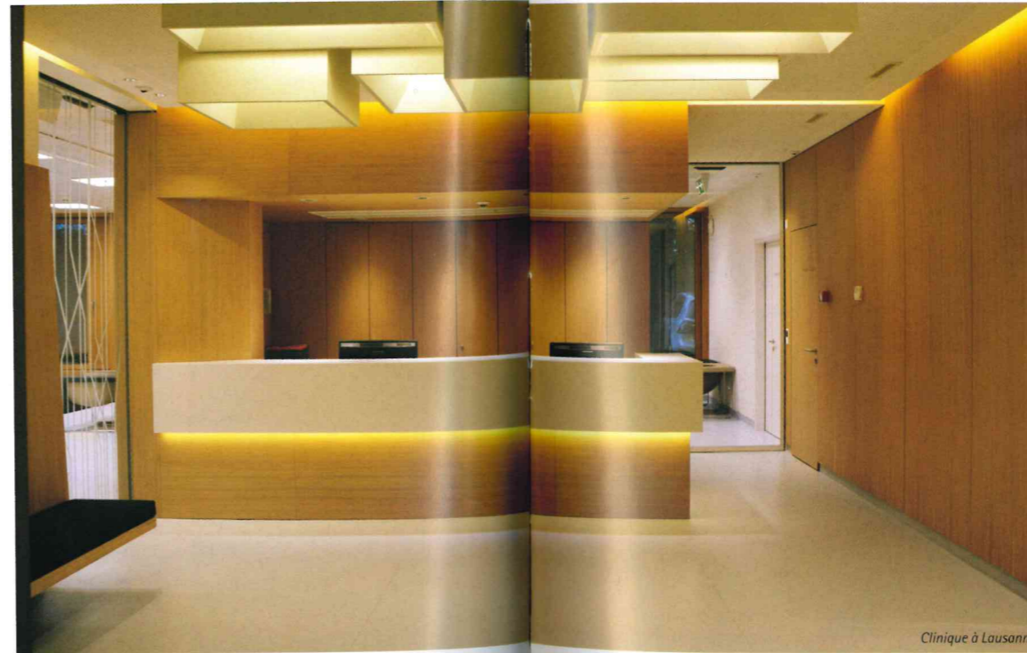
Clinique à Lausanne

Les Carneiro se limitent à choisir deux matériaux, voire, plus rarement, trois, pour rehausser les contrastes. Toujours selon leur inclination pour l'harmonie, ce minimalisme dans les matières leur permet de sélectionner «ce que l'on souhaite mettre en valeur». L'immeuble de la rue des Moraines à Carouge présente un vibrato de beige sable sur les deux niveaux inférieurs et de noir sur le dernier niveau, embelli dans son horizontalité.