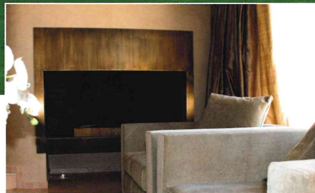
Une maison tout en distinction et en finesse, dans la campagne genevoise.

Des espaces à imaginer, à structurer, à mettre en scène. Pour le couple d'architecte genevois, la création est un exercice complet qui va de la conception et du plan d'un bâtiment jusqu'à son aménagement intérieur et au choix du design. Une approche intégrée qui est aussi un exercice de style et une recherche d'harmonie.