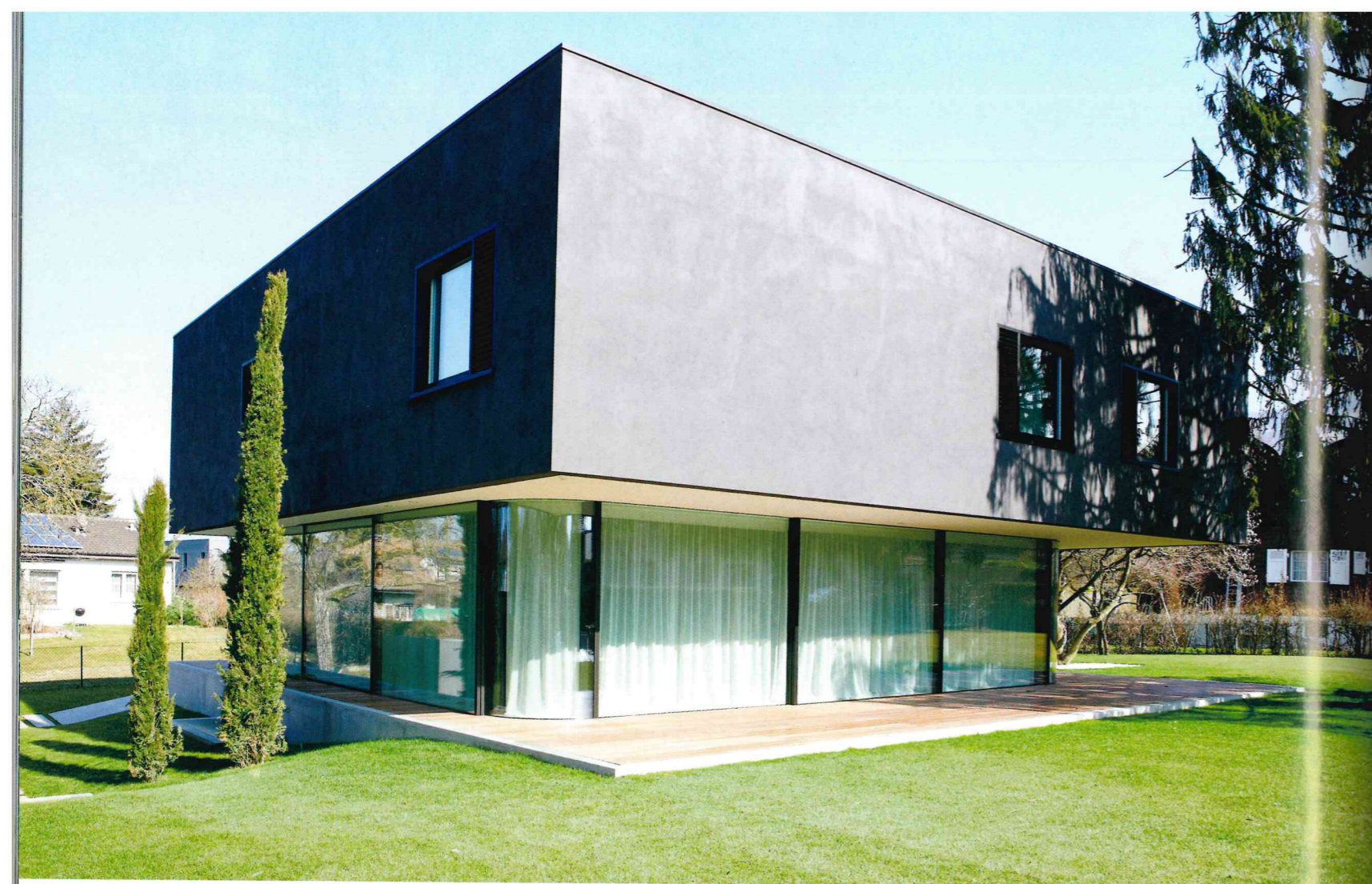
Posée sur un socle de béton, la maison affronte la légère pente du terrain par un pliage qui génère la rampe d'accès.