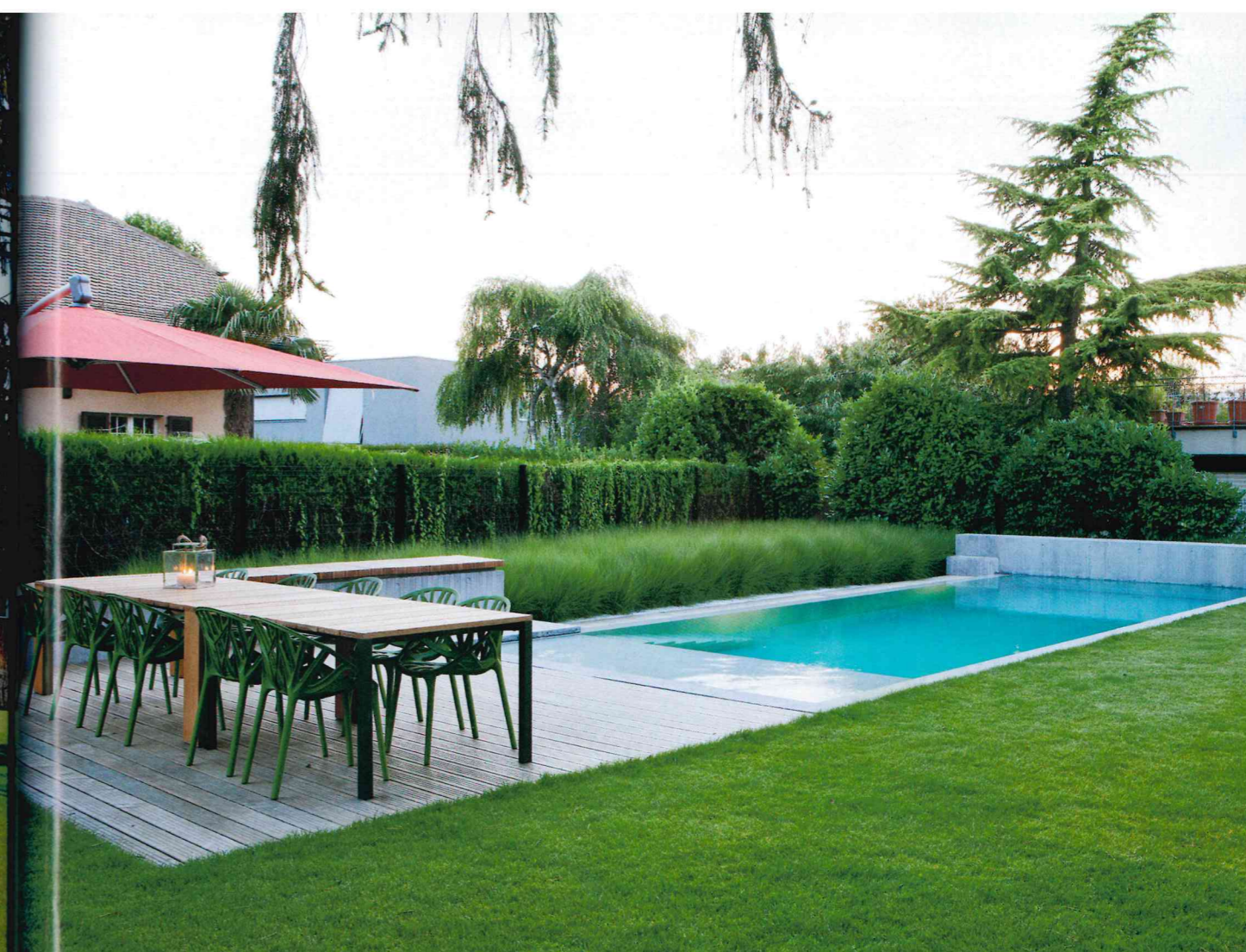
La piscine en pente douce débouche latéralement sur les massifs de